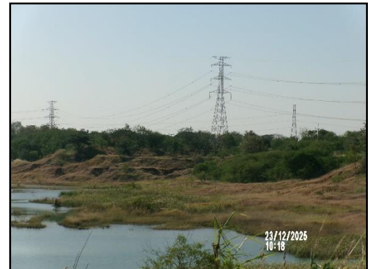
ภาพที่ 2.3 การเว้นระยะห่างจากแนวสายไฟ