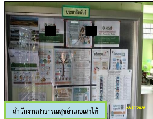
สำนักงานสาธารณสุขอำเภอเส้าไห้