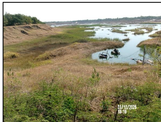
ภาพที่ 2.23 บ่อรวบรวมน้ำ (Sump)