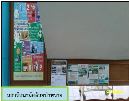
สถานีนามัยห้วยป่าห้วย