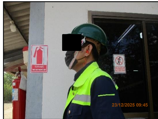
ภาพที่ 2.25 พนักงานสวมใส่อุปกรณ์ป้องกันอันตราย