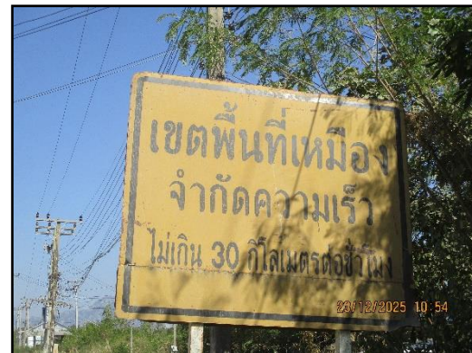
ภาพที่ 2.12 ป้ายจำกัดความเร็วไม่เกิน 30 กิโลเมตร/ชั่วโมง