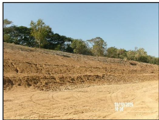
ภาพที่ 2.19 การเปิดหน้าเหมืองในลักษณะชั้นบันได