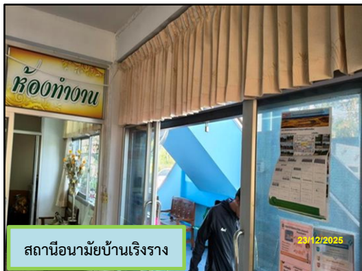
สถานีนามัยบ้านเริงราง