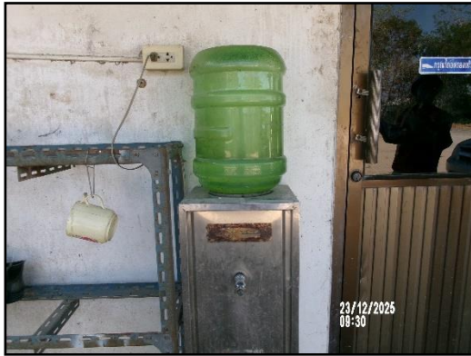
ภาพที่ 2.17 ตู้บริการน้ำดื่มภายในพื้นที่โครงการ