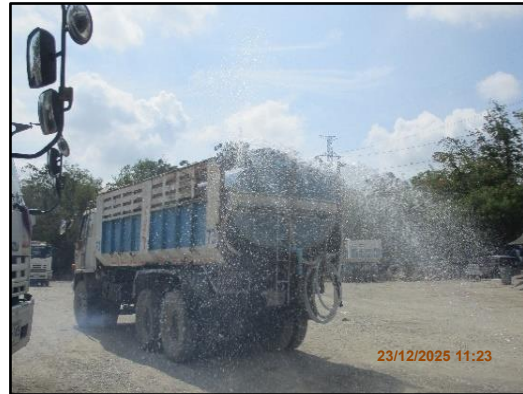
ภาพที่ 2.21 รถบรรทุกน้ำคอยฉีดพรมถนนภายในพื้นที่โครงการ