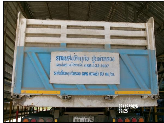
ภาพที่ 2.13 รถบรรทุกที่มีการติดชื่อโครงการ และหมายเลขโทรศัพท์