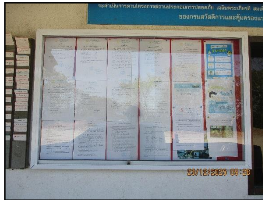
ภาพที่ 2.10 บอร์ดประชาสัมพันธ์ความรู้ต่างๆ ภายในพื้นที่โครงการ