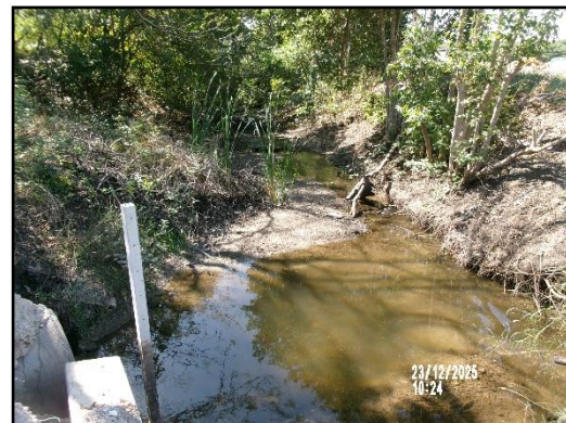
ภาพที่ 2.9 คูระบายน้ำด้านนอกคันทำนบ