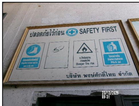
ภาพที่ 2.26 ป้ายเตือนบริเวณที่มีความเสี่ยงและกำหนดให้สวมใส่อุปกรณ์ป้องกันอันตรายส่วนบุคคล