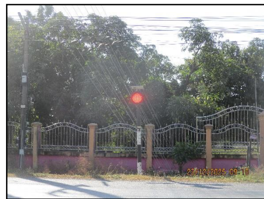
ภาพที่ 2.11 ป้ายจราจร และสัญญาณไฟให้ชะลอความเร็วบริเวณช่วงก่อนเลี้ยวเข้า-ออก พื้นที่โครงการ