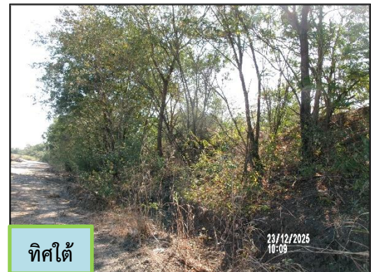
ภาพที่ 2.4 คันทำนบกั้นดินของพื้นที่โครงการ