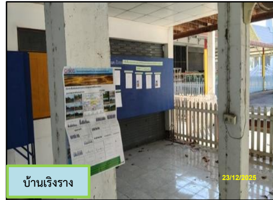
ภาพที่ 2.2 (ต่อ) ป้ายประชาสัมพันธ์ผลการตรวจวัดคุณภาพสิ่งแวดล้อมภายในชุมชนบริเวณโครงการ