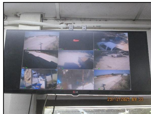
ภาพที่ 2.27 การติดตั้งกล้องวงจรปิดภายในพื้นที่โครงการ