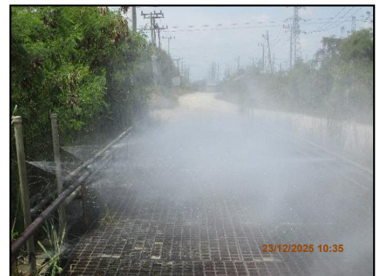
ภาพที่ 2.5 บ่อล้างล้อรถบรรทุกในช่วงถนนคอนกรีตของเส้นทางขนส่งแร่