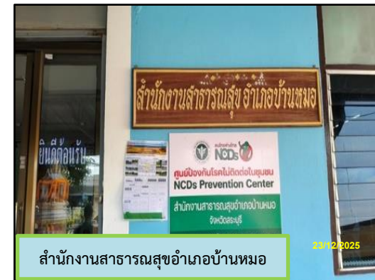
สำนักงานสาธารณสุขอำเภอบ้านหมอ