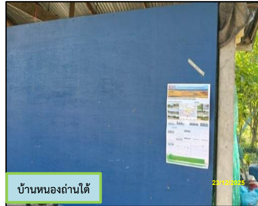
บ้านหนองถ่านใต้