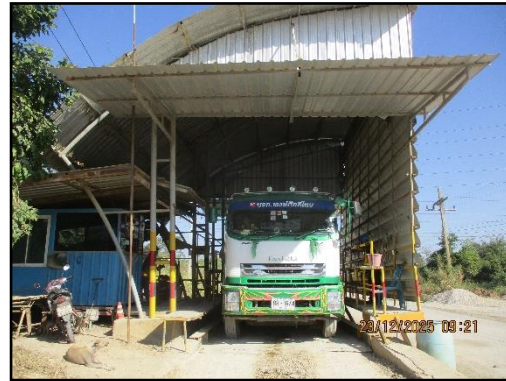
ภาพที่ 2.24 ด้านซังน้ำหนักรถบรรทุกขนส่งแร่