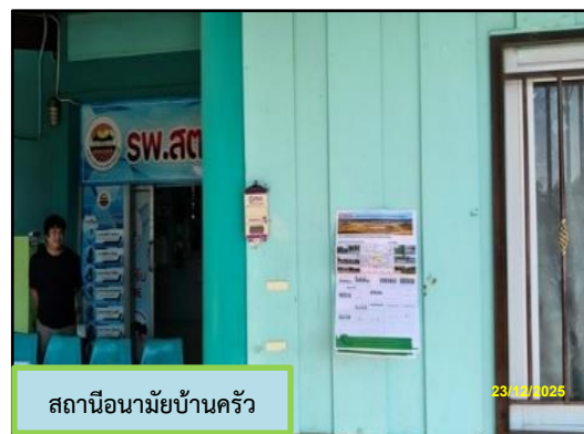
สถานีนามัยบ้านครัว