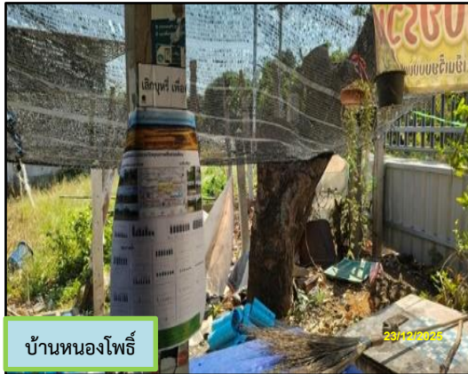
บ้านหนองโพธิ์