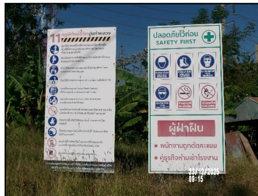
ภาพที่ 2.14 นโยบายความปลอดภัยอาชีวอนามัย และสิ่งแวดล้อมในการทำงาน