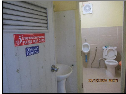
ภาพที่ 2.18 สุขาภายในพื้นที่โครงการ