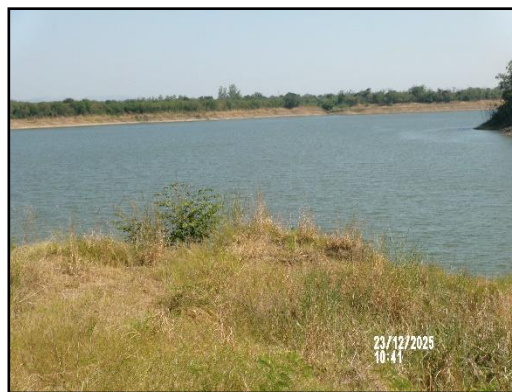
ภาพที่ 2.20 จุดรับน้ำเพื่อนำมาฉีดพรมถนนลำเลียงแร่