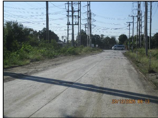
ภาพที่ 2.6 สภาพเส้นทางขนส่งแร่ (ส่วนบุคคล) ช่วงก่อนเข้าสู่ทางหลวง