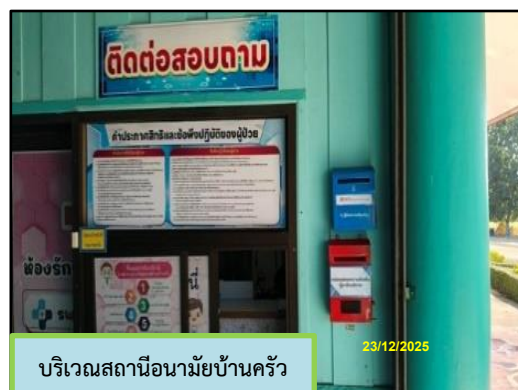
ภาพที่ 2.1 กล่องรับเรื่องราวร้องทุกข์