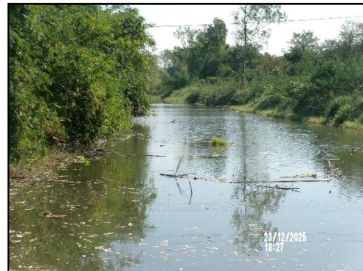
ภาพที่ 2.8 คลองห้วยแร่